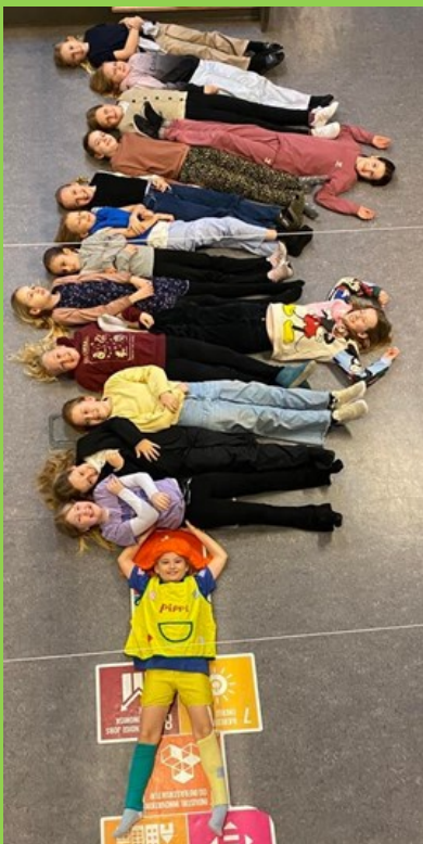
3.årg. Har arbejdet med Pippi

Referater fra Skolebestyrelsen kan ses her .